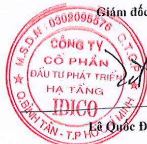
Ê Quốc Đạt